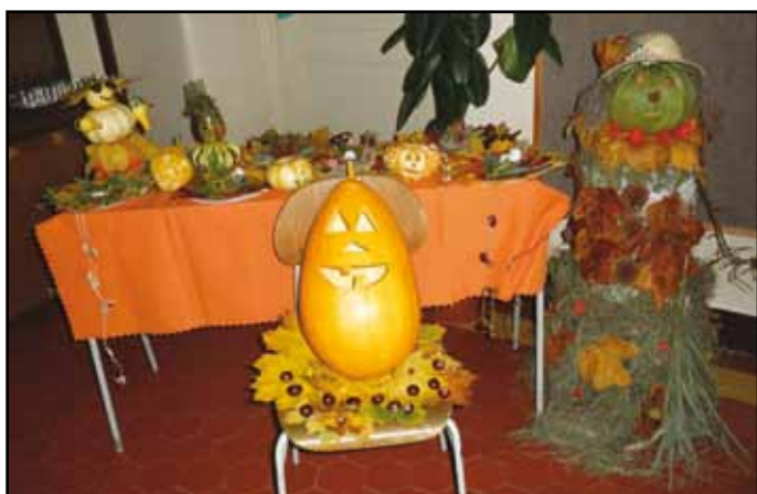
Výrobky žáků inspirované podzimem.