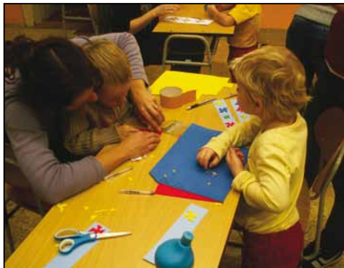
Při složitějších úkonech pomáhaly dětem maminky.