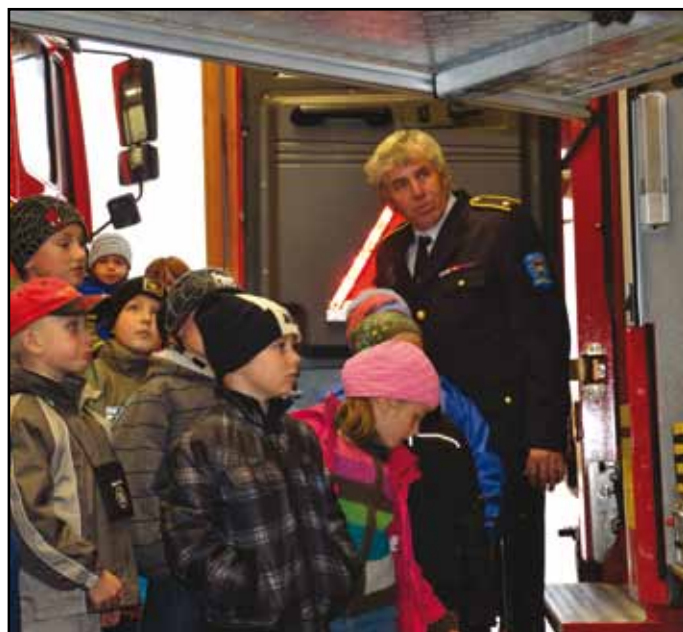
Při prohlížení techniky v hasičské zbrojnici v Neukirchenu.