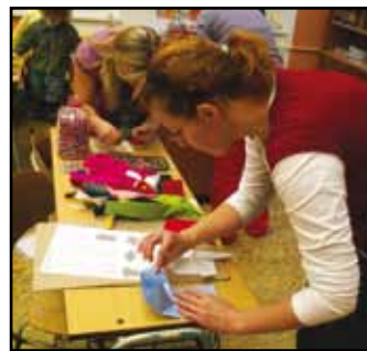
Děti vyráběly větrníky z různých materiálů.

V Nýrsku se zapojily především maminky s dětmi, ale přišli také 4 studenti. Tvořili se především sponky, gumičky a čelenky do vlasů, obaly na mobilní telefon, záložky apod. Tvorbu si každý volily podle své zručnosti a chuti tvořit. Vyráběli jsme z papíru, moosgumy, filcu a korálků. Do práce se ponořily také děti, které pomáhaly maminkám nebo zvládly vyrobit něco samostatně, např. záložku do knížky.