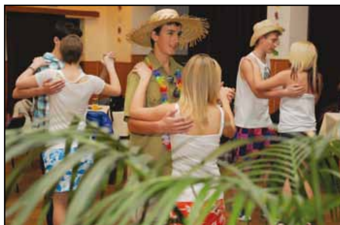
Z akcí DDM.

Organizace spolupracuje i s dalšími zájmovými složkami, např. s místní organizací Českého rybářského svazu