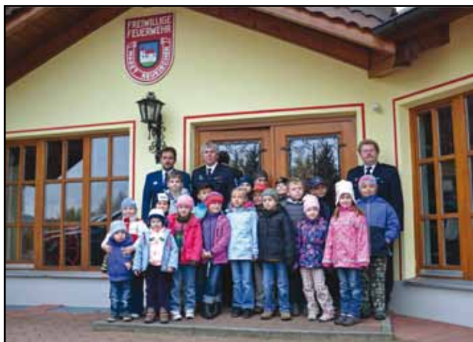
Nýrské děti na návštěvě u neukirchenských hasičů.

Nýrští hasiči mají široké a hlavně užitečné spektrum činností, vědí co je pro jejich budoucnost důležité, a tak mnoho času věnují výchově a vycviku mladých hasičů - od těch nejmenších špuntů až po ty náctileté, kteří rádi a s chutí navštěvují hasičský kroužek.