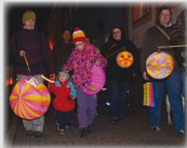
Účastníci lampiónového průvodu.

9. listopadu se uskutečnil v Nýrsku lampiónový průvod. Sraz účastníků byl na náměstí. Odkud se šlo průvodem při řece k Okule a po pěší zóně okolo cukrárny zpět. Na lávce byli všichni účastníci spočítáni a výsledek byl velmi pěkný: přes 450 lidí + děti v kočárcích a zhruba 200 lampiónů.