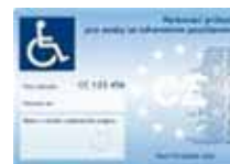
Staré zvláštní označení mot. vozidla O1 a nový parkovací průkaz O7.