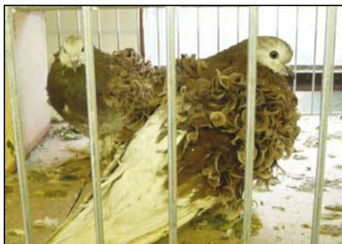
Některé živé exponáty z chovatelské výstavy.