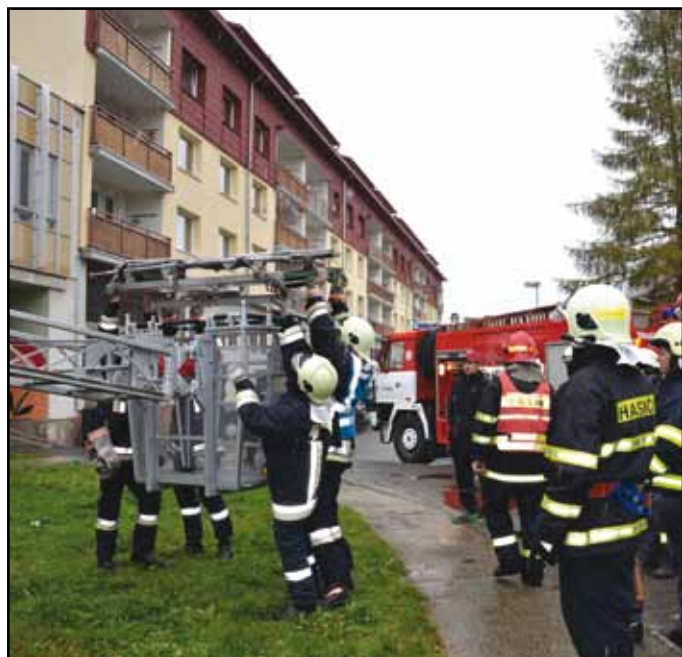
Přeshraniční společné cvičení hasičů v Nýrsku.

Společné cvičení probíhalo necelou hodinu. Simulovaný požár byl uhašen, pohřešované osoby zachráněny a to vše bez nejmenších komunikačních problémů. Všichni znali dobře svou práci a věděli dobře, co mají dělat. Stačilo ukázat a vše bylo jasné.