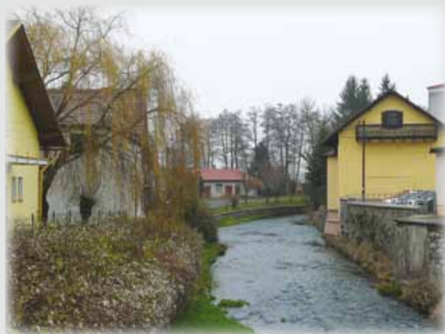
Pohled na řeku Úhlavu z mostu v Bezručově ulici dříve a dnes.

A pokud spíše fandíte umění, mohli jste zajít do areálu sýpků pod nádražím na již tradiční „Výstavu výtvarných děl umělců klatovského regionu“. Ta byla 1. září zakončena dražbou některých vystavených předmětů.