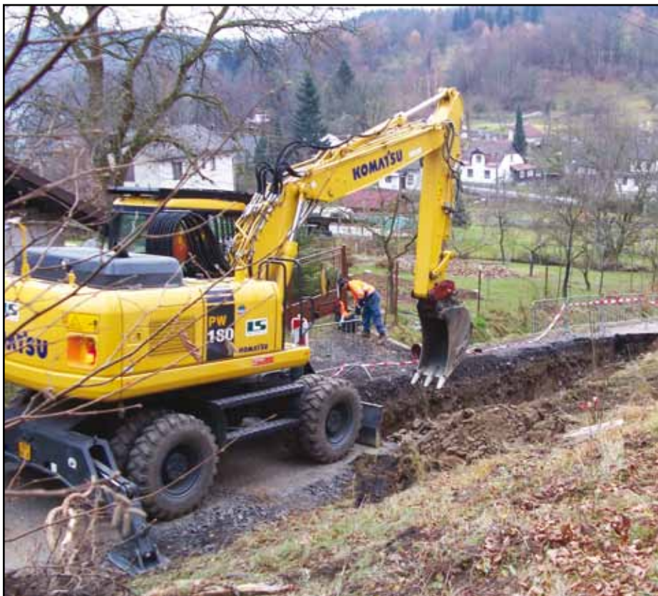
Budování kanalizace pro obce nad Nýrskou přehradou.