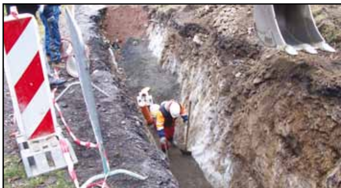
Výkop pro kanalizaci.

V souvislosti se zajištěním úspěšného zvládnutí všech prací kontaktovali majitele jednotlivých nemovitostí projektanti firmy PROVOD s. r. o., kteří zajišťují projektovou dokumentaci pro celou akci včetně připojení jednotlivých nemovitostí. V návaznosti na jejich činnost je vydáno stavební povolení pro vybudování kanalizačních přípojek pro jednotlivé nemovitosti. Snahou je minimálně zatěžovat občany administrativními úkony. Rovněž i finančně jsou tyto činnosti hrazeny z prostředků města. Dalším příspěvkem ze strany investora Města Nýrska je i to, že finančně zajistí vybudování kanalizační přípojky od hlavního řádu až na hranici pozemku vlastníka nemovitosti včetně dalších technických zařízení potřebných pro fungování tlakové kanalizace. Toto všechno je technický i finanční vklad investora, jehož snahou je naplnit podmínky přidělení dotace a zkvalitnit odvod splaškových vod z obce.