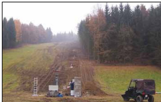
Obměna vleku na nýrské sjezdovce.

Při procházce k lesnímu divadlu jste mohli zaznamenat stavební ruch na nýrské sjezdovce. Firma SKI KORY s.r.o. připravuje obměnu vleku na této sjezdovce. V případě dobrých sněhových podmínek je předpoklad, že se zájemci „sklouznou“ na sjezdovce již v letošní zimní sezoně. (MěÚ)