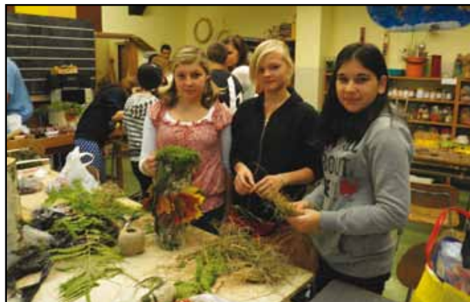
Tvoření žáků druhého stupně v rámci projektového dnu.

Žáci 1. stupně již v září uskutečnili poznávací exkurzi „Podzimní Šumava“, proto projektový den zaměřili na podzim v Nýrsku. V průběhu celého školního roku mají naplánováno doslova detektivní sledování jednotlivých částí města a jejich proměn v souvislosti s ročními obdobími nebo záměry Města Nýrsko. Pod „drobnohledem“ malých pozorovatelů se tak ocitly ulice Prap. Veitla, Bezručova a Strážovská ulice, ulice Práce a náměstí. Naši nejmenší se odvážně